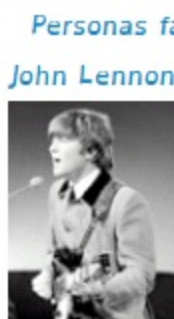
Personas famosas: John Lennon