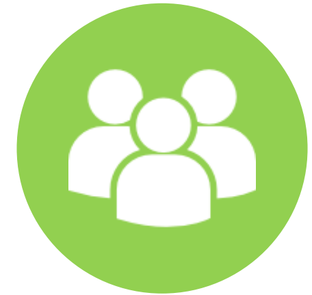
Presentación a la Comunidad Escolar