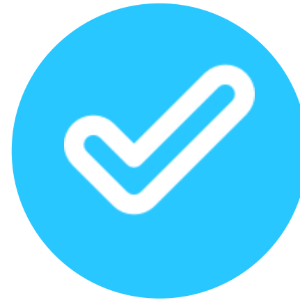
Ejecución de Actividades