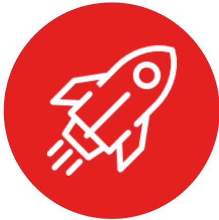
Lanzando el Proyecto