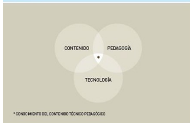
GRÁFICO 5.1 Contexto escolar

le antepone un proceso de apropiación personal" . En algunos países – como Argentina y Uruguay – las políticas nacionales han logrado mejorar la conectividad y han entregado computadoras a los maestros. Estos esfuerzos han dado lugar a un enorme crecimiento en el número de profesores con computadoras e Internet en sus hogares: en Uruguay, por ejemplo, 90% de los profesores tienen una computadora personal y 78% tienen acceso a Internet. Aunque las políticas públicas ayudan, una tendencia a aumentar la apropiación personal es también una tendencia natural – por lo que se puede esperar que el número de docentes con computadoras personales seguirá creciendo. Y cuando los maestros tienen computadoras en casa, son más propensos a usar redes informales como grupos de Facebook para compartir y pedir consejos, usar redes de colegas ( peer-to-peer networks ) o redes de profesores de cobertura mundial, acceder a seminarios web y encontrar cursos en línea (MOOCs) relacionados a sus clases.