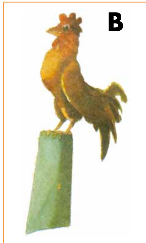
b) Cada pinta de este gallo es diferente.