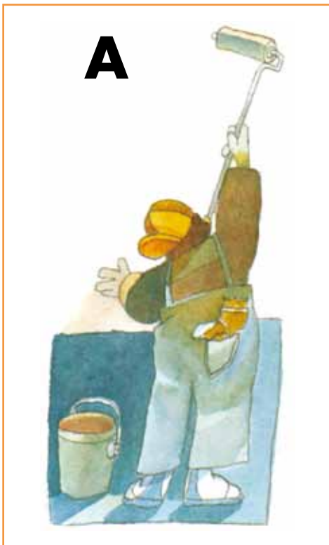
a) El pintor pinta la casa.