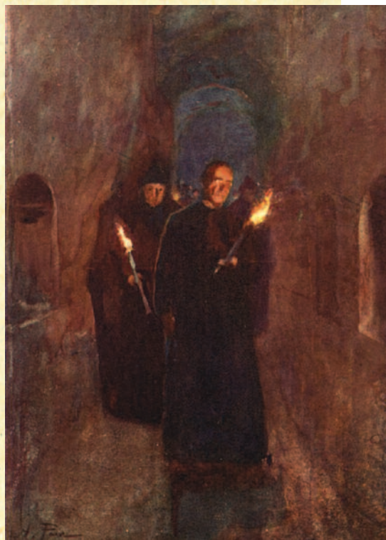
Catacumbas de San Calixto, en Roma.

Esta situación llevó al emperador Constantino a promulgar el “Edicto de Milán”. A través de este documento, Constantino legalizó el culto cristiano y favoreció económicamente a las comunidades cristianas, liberándolas de pagar impuestos y realizando donaciones para la construcción de templos. El emperador Teodosio llevó hasta las últimas consecuencias la política de su antecesor y declaró el cristianismo religión oficial y única del Imperio. De esta manera, inauguró la alianza entre el poder político y el religioso.