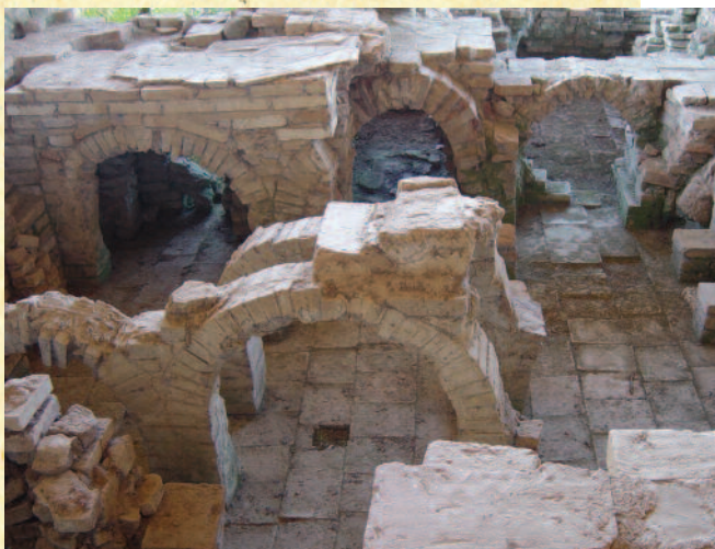
Ministerio de Educación y Ciencia de España.

Los habitantes de las regiones sometidas empezaron a aceptar la cultura de los romanos, a vestirse como ellos, a comprender, hablar y escribir el latín, a frecuentar las termas y los espectáculos públicos. Este proceso de romanización se desarrolló con mayor intensidad en las principales ciudades del Imperio.